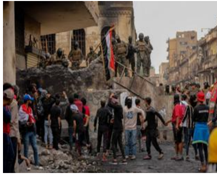
انتفاضة تشرين بين المتاريس ولعبة الانتخابات

هذه ليست أزمة أفراد، بل أزمة سياق كامل. سياق ثقافة مشهدية، شعارات جدران، تلقينات مدارس، وعوائل وأحزاب تعيد إنتاج (مجتمع الغنيمة): مجتمع يرى العالم ساحة اقتتال دائمة. في هذا المناخ تختفي العلوم، تختفي المساحات الرمادية، ويتحول الكون إلى ثنائية بدائية: أبيض أو أسود، معنا أو ضدنا. عقل مانوي (هو ذلك النمط من التفكير الذي يرى العالم في ثنائيات قاتلة، خير/شر، معنا/ضدنا، ويعجز عن رؤية التفاصيل والمساحات الرمادية التي تُنتج الفهم الحقيقي.) لا يرى التفاصيل، رغم أن التفاصيل وحدها تصنع التحولات الكبرى.