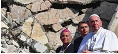
من العراق البابا فرنسيس