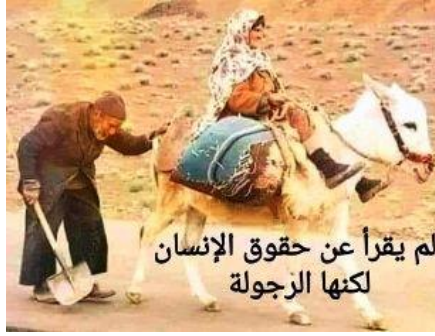
لم يقرأ عن حقوق الإنسان لكنها الرجولة