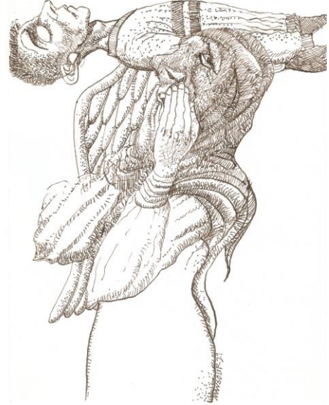
** شهيد ثورة تشرين - منصور البكري

الفنان التشكيلي المبدع منصور البكري يصور لنا المشهد.