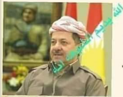
مسعود البرزاني نسخة منه الى :- المنبطين

يتداول المكاريد مثلاً شعبياً حين – تتلاص – عليهم الامور وما اكثر اللوصات ، وحين تاتينا طر كاعة جديدة ليست في الحسابن فنصفق يدا بيد ونجر حسرة وآهة ونقول :