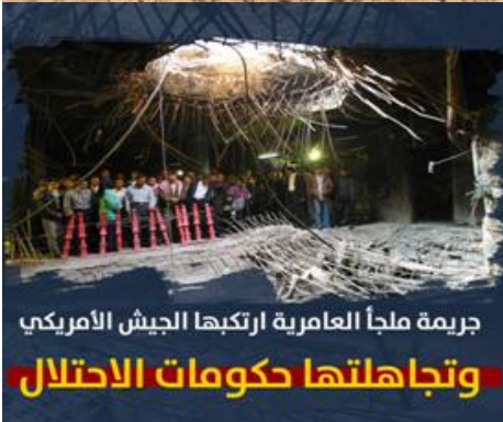
جريمة ملجأ العامرية ارتكبها الجيش الأمريكي وتجاهلتها حكومات الاحتلال