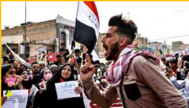
* حقوقي وناشط مدني