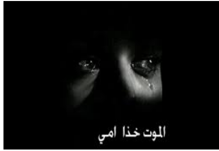
الموت خذا امي