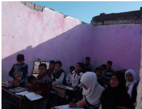
فساد مشاريع الأبنية المدرسية في العراق

فكرة كل من الاكتشاف والابتكار هي جعل المجهول معروفاً. هذه هي الطريقة التي يتم بها إضافة جزء جديد من المعرفة إلى ذخيرة المعرفة الحالية، وبالتالي، يتوسع مجال العلوم. البحث، الذي ليس أصلياً أو دون المستوى المطلوب، لا يمكنه القيام بهذه المهمة. هذا هو المكان الذي أصاب فيه الانتحال والاقتراب بشدة مجتمع الأبحاث. ما هو مهم في أطروحة البحث هو كيفية بناء الفرضية (أو كيف يتم فرز سؤال البحث)، ولماذا يتم اعتماد منهجية معينة وكيف يتم تفسير النتائج. هذه هي النقاط التي يجد فيها الطلاب صعوبات في كتابة أطروحات أبحاثهم. كيفية محاولة الكتابة العلمية هي العقبة الكبيرة التالية. جزء لا يتجزأ من هذه العقبة هو مشكلة عدم التمكن من اللغة الإنجليزية. لم يقدر الطلاب بعد فكرة أن اللغة الإنجليزية هي الآن لغة العلم. للتغلب على هذه العقبات، يجب تدريس كتابة البحث واللغة الإنجليزية بشكل أفضل بكثير مما هما عليه حالياً.