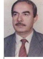
د. عبد الجبار العبيدي

ويلى ابن اسحاق الواقدي في المغازي (ت 207 للهجرة). كان مؤرخاً صادقاً دقيقاً، ونقل من الرواة الثقات مدار في عهد الرسول وما بعده. ومن يقارن بين ابن اسحاق والواقدي وبين ابن هشام فسيرته هي في الحقيقة أدب وليست تاريخاً. أن المؤرخين الثبت لا يطمنون الى سيرة ابن هشام، فسيرة رسول الله (ص) أعز علينا من أن نعتد في أصولها على ما كتبه رجل كان يتصرف على هواه وما يتطلب أمر السلطة ومصحتها.