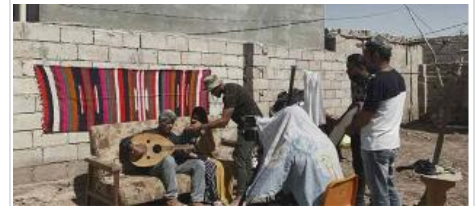
"شاش" فيلم عراقي - مغامرة سينمائية باستخدام المؤثرات وعناصر المفاجأة.