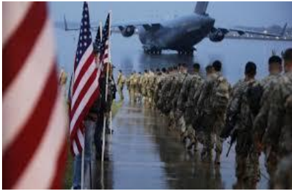
خلال غزوها للعراق .. هل فقدت الذاكرة؟

بالبنى التحتية و المدنيين ، وعلى اثر هذا الإعلان وبدء دخول القوات الروسية الى أوكرانيا ، ارتفعت أصوات حلفاء النازية الجديدة ، ومعهم بعض من اليسار الحليف للصهيونية والامبريالية ، يذرفون الدموع على أوكرانيا بحجة السلام و التفاوض من أجل حل المسائل العالقة بين الطرفين ،