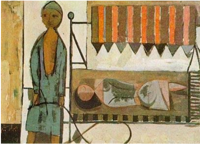
من أعمال الراحل جواد سليم

مؤشراً بإصبعه الصغيرة الى أعلى حيث يستقر تمثال الفارس الجواد , وهكذا كان يلقب التمثال , منادياً أمه : انظري أُمي انظري إنه يبكي... رفعت الأم عينيها ناظرة الى الأعلى حيث التمثال المنصوب .. شئ ما يلعب في عينيها قالت متممة بكلمات لا مبالية .. ثم سحبته من يده الصغيرة بقوة قائلة بصوت عالٍ: إمشي .. إمشي ... إنها الشمس تلمع أعلى الصنم. مَرَّ رجل طاعن في السن محني الظهر .. وينصف التفاتة إلى الأعلى شاخصاً بصره أعلى التمثال متمتماً في نفسه : أنا سعيد أنه هنالك من لا يزال شامخاً لم تحن السنين ظهره مثلي. طارَ عصفور صغير وحطَّ على كتف تمثال الفارس الجواد .. ثم نظر الى عينيهِ وقال: أتبكي؟!!